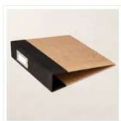
Album 6" X 8" (15,2 X 20,3 Cm) Noir Nu - 163883

Matériel utilisé - Boutique : http://www.boutiquenesiris.com