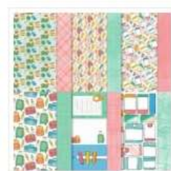
Papier De La Série Design 12" X 12" (30,5 X 30,5 Cm)