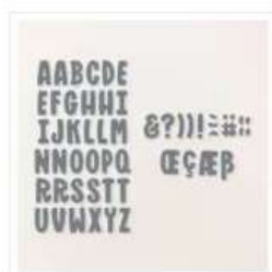
Poinçons Mini- Alphabet - 162934