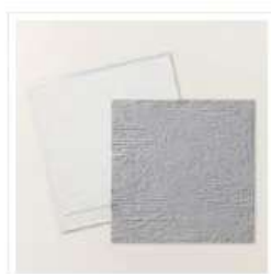
Plioir À Gaufrage 3D Vieux Mur De Briques - 161600