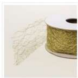
Galon À Tissage Léger 1-1/2" (3,8 Cm) Or - 165715