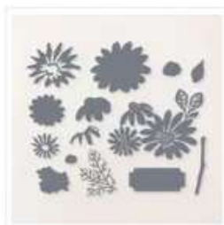
Poinçons Marguerites Enjouées - 161296