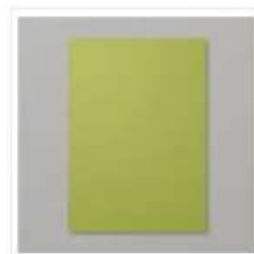
Papier Cartonné A4 Vert Olive - 106576