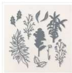
Poinçons Pensées Affectueuses - 163313