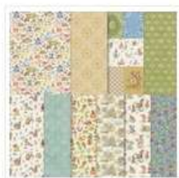
Papier De La Série Design Spécialité 12" X 12" (30,5 X 30,5 Cm) Livre De Contes - 164662