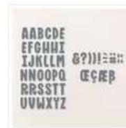
Poinçons Mini- Alphabet - 162934 Price: 38,00 €