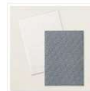
Ploir À Gaufrage Étoiles Rayonnantes - 164972 Price: 0,00 €