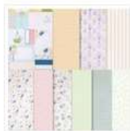
Papier De La Série Design Spécialité 12" X 12" (30,5 X 30,5 Cm) Anniversaire Aux Fleurs Sauvages - 164591 Price: 20,00 €