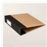
Album 6" X 8" (15,2 X 20,3 Cm) Noir Nu - 163883 Price: 14,00 €

Si tu veux acquérir le matériel de base, pense à ajouter le code Hôtesse du mois pour recevoir tes cadeaux exclusifs : FEVRIER 2025 : MNDQMYCR