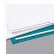
Bandes Adhésives En Mousse - 141825 Price: 10,00 €