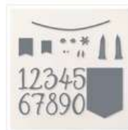
Poinçons Fête D'anniversaire - 164598 Price: 33,00 €