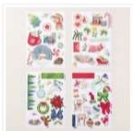
Lot Éphémère Spécialité À Combiner Joyeuses Images - 164110