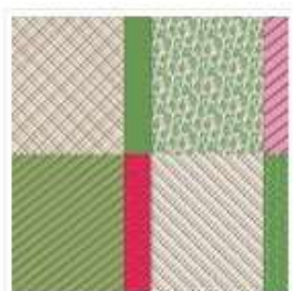
Papier De La Série Design 6" X 6" (15,2 X 15,2 Cm) Nœud Cadeau - 164309

Si tu veux acquérir le matériel utilisé, pense à ajouter le code Hôtesse du mois pour recevoir tes cadeaux exclusifs : En Décembre : TR4GQDQH