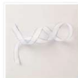
Ruban Extra-Fin 1/2" (1,3 Cm) Argent Et Blanc - 162149