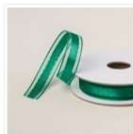
Ruban De Satin Et Diaphane 1/2" (1,3 Cm) Sapin Ombragé - 164224