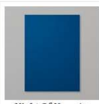
Night Of Navy A4 Card Stock [106577] 14,00 €