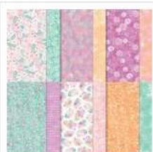
Unbounded Beauty 12" X 12" (30.5 X 30.5 Cm) Designer Series Paper [163372] 15,25 €

Si tu veux acquérir le matériel utilisé, pense à ajouter le code Hôtesse du mois pour recevoir tes cadeaux exclusifs : en Août : EAQG47FB