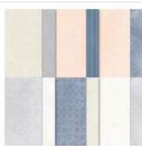
Country Lace 12" X 12" (30.5 X 30.5 Cm) Designer Series Paper [163415] 15,25 €