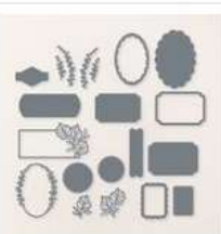
Unbounded Love Dies [163383] 44,00 €