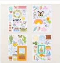
Something For Everything Mix & Match Ephemera Pack [163763] 9,75 €