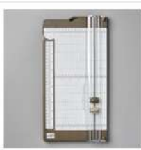
Paper Trimmer [152392] 34,00 €