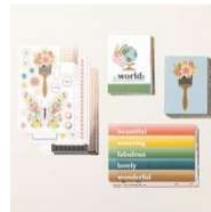
Sweet Thoughts Memories & More Card Pack [162930] 12,25 €