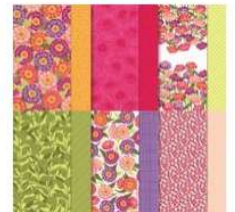
Flowering Zinnias 12" X 12" (30.5 X 30.5 Cm) Designer Series Paper [163469] 15,25 €

Rdv tous les derniers Lundis de chaque mois : 26 février, 25 mars, exceptionnellement 22 avril, 27 mai, 24 juin dès 14h30 sur FB / Insta / Youtube