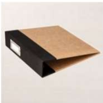
Basic Black 6" X 8" (15.2 X 20.3 Cm) Album [163883] 14,00 €

Si tu veux acquérir le matériel de base, pense à ajouter le code Hôtesse du mois pour recevoir tes cadeaux exclusifs : WSVDFCJF