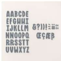
Mini Alphabet Dies [162934] 38,00 €