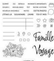
Set De Tampons En Résine Souvenirs Mémorables (Français) [162921] 25,00 €